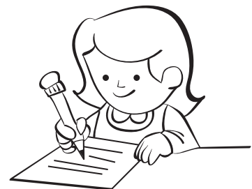
LO QUE SÉ DE LAS CLAVES