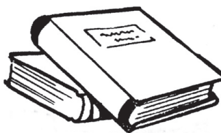
CLAVES DEL TEXTO